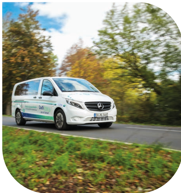
Layout: Lindenmayer+Lehning, Darmstadt